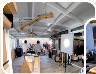
作者夫婦也開放家居舉辦婚姻課程及輔導工作

那時我倆關係修復不久，丈夫要在人前坦承不忠，壓力如山，每次分享前都夢到自己赤身示眾！我們曾經掙扎不再應邀，但最終決定堅持。分享百回，我們發現上帝每每賜下嶄新經歷，持續醫治我們。