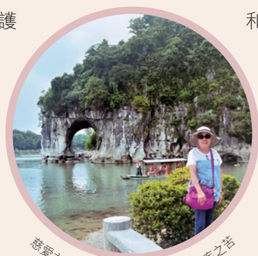
慈愛主陪伴並賜力量給媽媽面對惡疾之苦

「一粒麥子不落在地裏死了，仍舊是一粒，若是死了，就結出許多子粒來。」（約翰福音十二24）