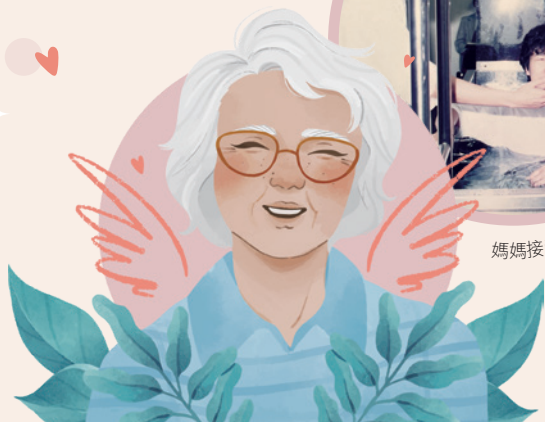
媽媽接受浸禮，立志一生信靠主。