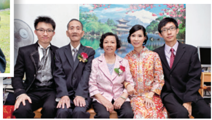
作者深感爸爸能見證她結婚生子，是上帝對爸爸生命莫大的賜福。