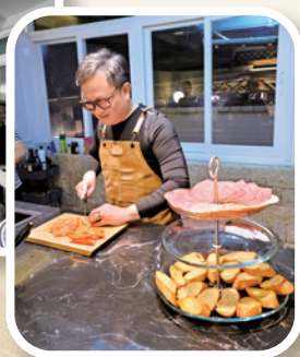
丈夫準備愛筵與弟兄姊妹分享