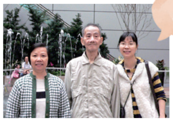
作者（右）與父母同歷上帝的大愛大能

2009年某天，我收到醫院通知：爸爸在街上暈倒，被送到醫院去。在住院治療期間，爸爸不但染上肺炎，還發現肺部有癌細胞；更壞的情況是他一直昏迷不醒。那時，我立即浮現的擔憂是：他仍未信主得救恩！