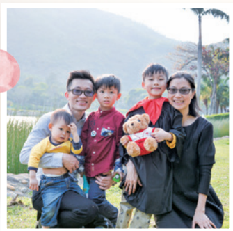
作者（右）與丈夫及孩子

我深深體會到上帝話語的愛與力量，祂使萬事互相效力，化詛咒為祝福，祂的愛圍繞我們一家；因此我立志要一生事奉上帝。我更深深感受到聖經使人得着盼望，更有改變生命的能力，我渴望能藉上帝的話語祝福更多人。✉