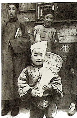
在甘肅，移民孩子從小便上阿拉伯文課 L37-047