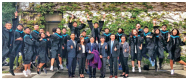
作者（右二）於中文大學畢業後，一心一意要當教師。