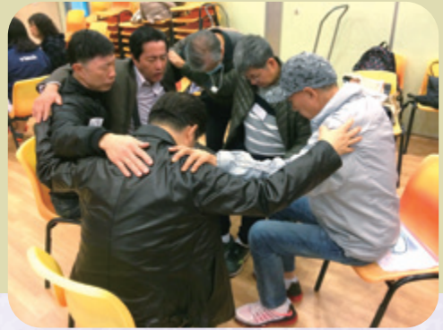
在小組中，男士們同樣獲得支持和鼓勵。

2014年成功獲批為期三年的資助，其後再申請，也能繼續獲批資助。感恩，相關服務至現時仍能一直順利發展。