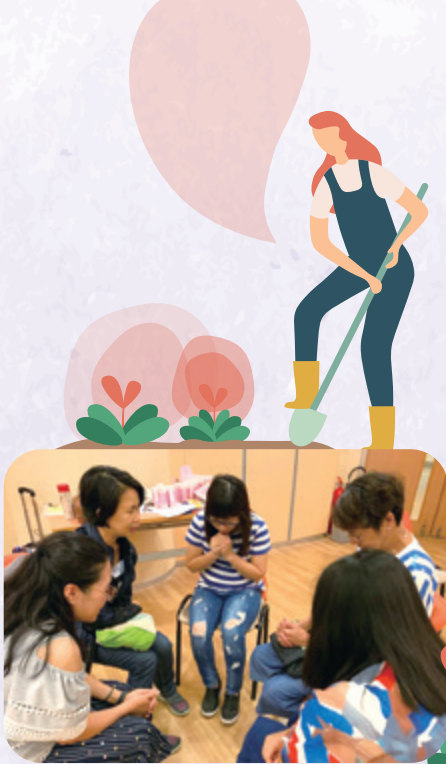
「關顧照顧者靈性」小組中，照顧者有空間可以抒發情感，彼此分享互勉。

敘事治療 (Narrative Therapy)，了解有關自我身分認知的重要，感到家長們也需要好好照顧『自己』。」