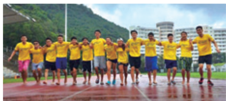
作者（左二）與大學同學合照