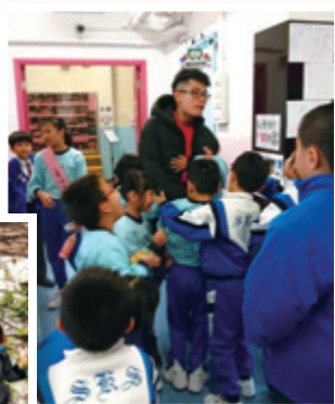
教學雖然辛苦，但作者（面向鏡頭者）認為給孩子們提供快樂童年很有意義。