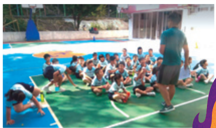
作者深信為人師表要向學生傳遞正確價值

我愛學生，但若他們犯錯我亦會責備，然後解釋問題所在，使之明白老師的出發點是愛他們。這裡部分是有特別需要的學生，間會在課堂中情緒失控，造成秩序混亂，甚至打架；處理後同學確有改善，