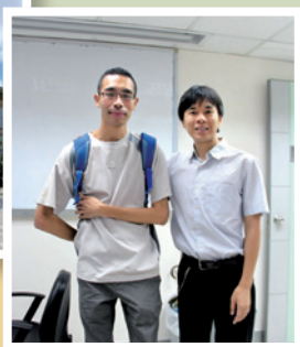
作者於「心理學概論」課程中，得到老師 Billy Sir 啟發他對心理學的興趣。

習意欲。後來一天，偶然聆聽詩歌 God will Make a Way ，上帝藉著歌詞感動並鼓勵我在耶穌面前認罪和悔改。縱使身陷困難的境況中，但主耶穌並沒放棄我，依然不離不棄，這份體驗是非常清晰和真實。於是我漸漸改變學習方式，並擺脫那份沉重壓力，可較專注溫習。因起步已晚，在公開試中的成績始終不合格，教我感到難過和懊悔，但感謝上帝賜我心靈平安，並在腦海浮現聖經的話語：「我豈沒有吩咐你嗎？你當剛強壯膽！不要懼怕，也不要驚惶；因為你無論往哪裡去，耶和華——你的上帝必與你同在。」（約書亞記一 9）我坦然承認自己的軟弱，並憑信心交託一切在天父手裡；這事並不容易，是我每天透過禱告，建立與上帝的親密關係而獲得。