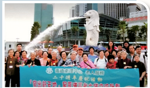
作者（後排左四）與長者們到新加坡交流