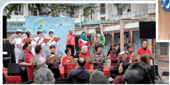
為讓更多人得著救恩，作者（台上右三）與福音粵曲隊在屋邨獻唱。

有一晚我全身又酸又痛，不能入睡很辛苦，忽然記起牧師提過任何難處都可祈求耶穌幫助。於是我嘗試祈禱，朦朧間便睡著，翌日骨痛減輕了，人也舒服了，便立即感謝耶穌。自此心裡就有了祂，更在一次聚會中決定信主，並在緊接的星期日參加香港天樂浸信會聚會。那是我人生第一次踏足教會，很多弟兄姊妹都來歡迎我，令我既開心又感動。之後每週都去崇拜，教會弟兄姊妹對我關心呵護，視我如家人，我也不再收藏自己，主動與人