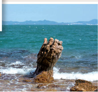
位於香港最古老地層的黃竹嘴，海水退潮後在淺水處見到不少受海浪侵蝕的岩礁，其中一塊很像祈禱手。