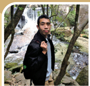
作者行山時於小夏威夷徑留影

記得去年自己在預備公開試及應考過程中，遇到前所未有的壓力，甚至引起失眠，更出現厭倦學習的情緒，完全沒有動力溫習。我經常逃避考試壓力，欠缺專注力又懶散，