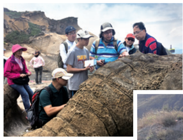
過去曾與香港 TGI 學員在台灣東北角野柳講述蓋石的成因