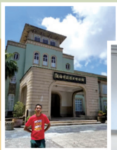
作者 2019 年往台灣旅遊時攝