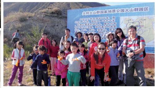
石頭叔叔與學生們在山西大同古老火山群其中的金山下考察

耶穌透過道成肉身住在人間，為我們的罪被釘上十字架，把人從罪中救贖出來。然而這個中心主題，只是其一。