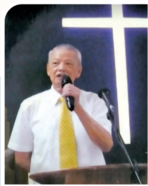
作者分享上帝在其身上的奇妙作為