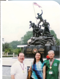
作者（右一）在馬來西亞留影