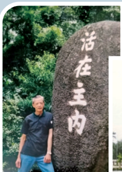
作者曾因迷信相士之言，浪費了青春歲月；幸而認識耶穌基督後，得著豐盛生命。