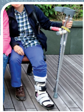
作者的太太因檢查天花漏水情況 不慎跌斷腳趾骨

打從2018年中起，因上層單位滲水所致，浴室天花經常漏水，石屎剝落，忙找管理處幫忙和協調。有時半夜聽見水滴聲音，很是痛心，因我和太太都很喜歡這單位。