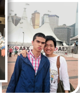
作者和兒子跟隨學校到中環摩天輪遊玩，讓他接觸社區。