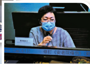
作者在立法會會議上反映嚴重智障人士的需要