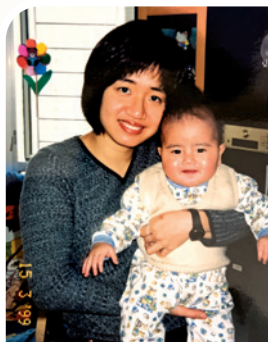
晞晞幼時需要服食類固醇控制腦癇發作，以致水腫。