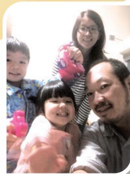
因知小孩的智慧由上帝賜予，作者夫婦常為他們禱告。