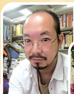
作者是在辦公室由同事帶領作信主的決志祈禱

為此，我告訴太太要重新回到教會，原來她一直等待着願意找尋上帝的這一天。跟着，大學的同