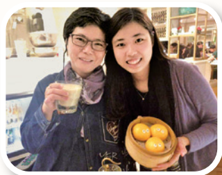
作者勸導女兒學習饒恕

香港爆發「沙士」前，老爺主懷安息。自此丈夫忙於中港澳的工作，我倆聚少離多。終於，丈夫沒能抵抗試探誘惑；枕邊人半夜未歸，我的淚水濕透枕頭。2006年他拋妻棄女，當時女兒未成年，我不肯離婚，他就搬出去。那段日子我家沒糧，但對我恩重如山的上帝沒忘記我，祂供應一切所需。住在圍村的我，當時免費幫鄰里的小孩補習，