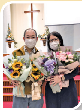
作者和太太一起受浸後合照