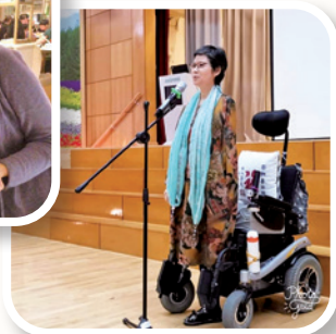
被選為「再生勇士」的作者到學校分享見證