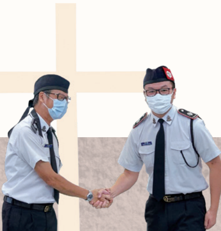
作者（右）與其 生命師傅鄧 Sir

記得我還是隊員的時候，有位同伴是單親的，讀書成績未如理想，也缺乏家人照顧。導師常在下班後去家訪，幫他補習，約他星期六出來午膳，然後一起去集隊。導師付出真心陪伴這位缺乏家庭溫暖的少年人，是出於上帝的愛。正是這份愛和生命的力量，推動我也要做個活出愛、跟隨基督的人，遂於2018年接受浸禮。