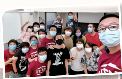
作者（最前右一）樂作與少年人 分享主愛的導師