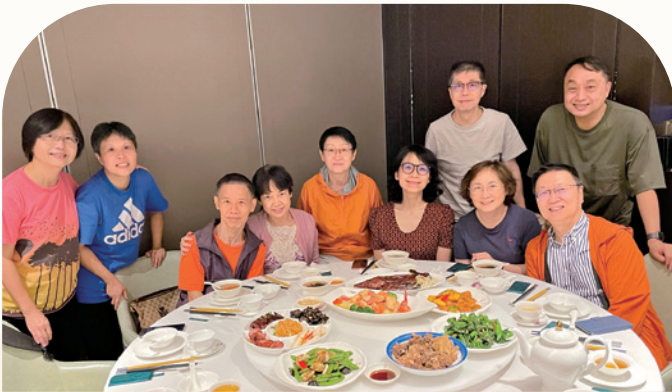
作者夫婦（左三及四）與教會團契合照