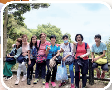
作者（左一）與教會姊妹郊遊時合照