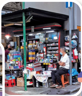
路旁的報紙攤販，以至每位香港人也是上帝所愛的。