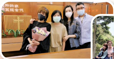
作者（左一）為主幫助她與女兒（右二）修復關係感恩。洗禮合照中還有作者的姊妹（左二）及作者的女婿（右一）。