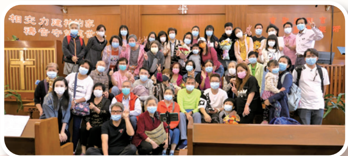
作者（中間戴黑色口罩者）在洗禮日與親友及教會弟兄姊妹合照

從小我就渴望自己將來可以建立一個溫馨的家，於是 18 歲中學畢業後就結婚。然而，我的婚姻並未如願幸福美滿。丈夫雖然各樣都好，可惜後來嗜賭如命，在屢勸不改下，最終我惟有選擇離婚，至今差不多已二十年了，女兒和兒子亦已長大。回顧過去，當時兒子是交給前夫撫養，女兒就由我負責，不過當時我要為生活奔波，所以把她交給我媽媽照顧。教我最遺憾的，是沒能親眼看着一對兒女每天成長的過程，而女兒對我的不了解，更令我感到無奈與心痛。多年來我一直希望能與女兒修復關係，信主後