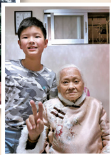
媽媽穿上孫兒送的過年新衣

回家後，一晚半夜，門鈴響了兩次，媽媽非常害怕，說「有污糟邋邋的來了」。原來她住院期間，經常夢見「細粒女」（她的一位已故舊友）纏着她，要帶她走，就認定是「細粒女」來按門鈴，心裏很驚慌。她再次找內地的大佛，大佛說她是被「鬼攬」，要立即為她做法事，至法事完成，便說安全了。哪知門鈴是鄰居小朋友貪玩按的，並不是被「鬼攬」。這事讓她看到大佛的虛假！