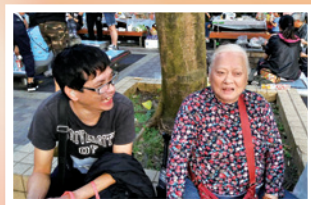
家人與媽媽到戶外燒烤

五月初的一個早上，媽媽突然說誰也不信了，又說大佛幫不到她，惟有信耶穌。她對耶穌說：「耶穌，祢能力很大。」我請她祈禱決志，她竟然願意！當日下午，她說有黑影纏她，且更大、更惡。她曾對黑影說：「我不會跟你，要跟耶穌。」之後那黑影就消失了。