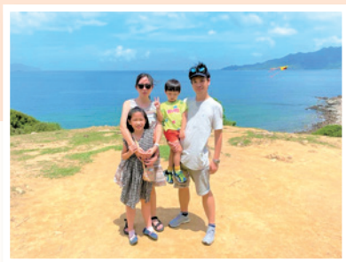
作者體會到信靠上帝的人必得平安和永恆的福氣。圖為他與太太及兩名女兒合照。

回看昔日的自己，性格較自我，總認為自己的事自己解決，不希望別人插手或同情，是個典型愛面子的大男人。後來才發現，原來人很渺小，無法掌控一切。