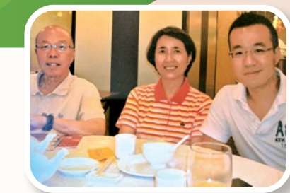
作者（右一）感恩媽媽（中）自小教導他聖經真理。圖為作者與父母合照。

己的利益。辦公室政治和複雜交錯的人事關係，使初出茅廬的我頓感迷惘。究竟怎可在這樣的環境下生存，又不致失去初心？我畢竟是在基督徒家庭長大，雖不熱衷信仰，惟從小上教會，以及多年來媽媽藉聖經給我諄諄教誨，真理的種子已植根心中成為價值觀，我實在不想初心變壞。