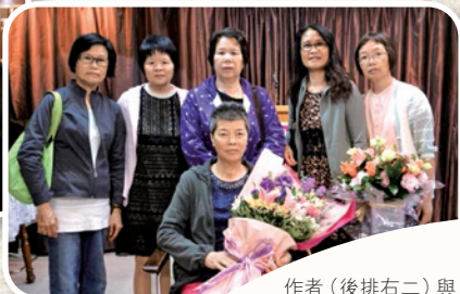
作者（後排右二）與教會姊妹