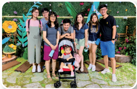
前排：作者與長孫女；後排：三對兒媳